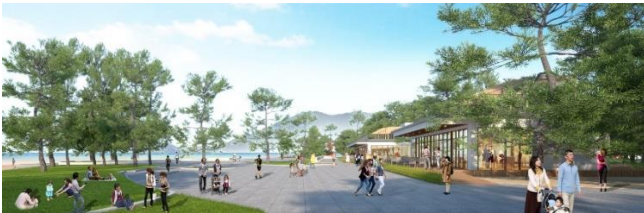
にぎわい施設イメージ